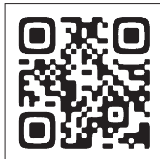
セミナー検索ページQRコード

※導入されているセキュリティ設定によっては、メールを受信できない場合がございます