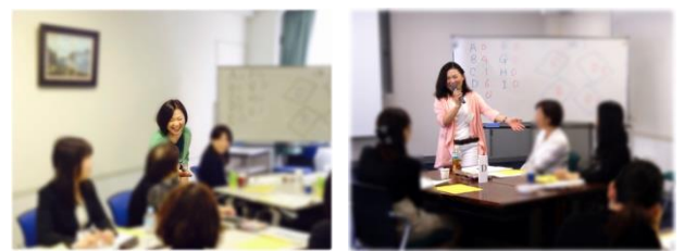
<過去のセミナー時の様子>